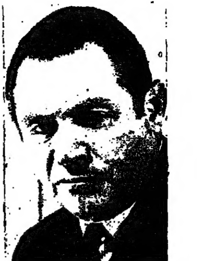
السيد اليعيزر شوستاك وزير الصحة في باقة الغربية.

وكان السيد شوستاك قد قام يوم امس برفقة السيد بنيامين غور اريه مستشار رئيس الحكومة للشؤون العربية والطبيب اللوائي في منطقة الخضيرة وعضو الكنيست السيد ايل نصر الذين بزيارة عمل تفقدية لتrophy عرعة وباقة الغربية في التلخيص الشمالي للوقوف على الأوضاع الصحية في هاتين القرئتين ومرض رئيسا.